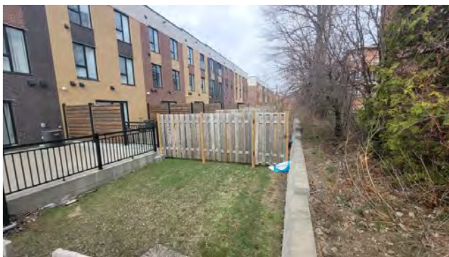
Aperçu de l'accès arrière