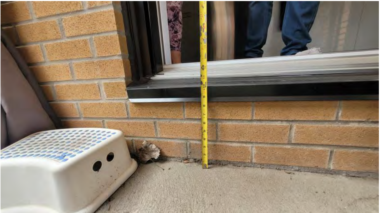
Il faudra installer une marche en béton préfabriqué devant chaque ouverture de porte-patio